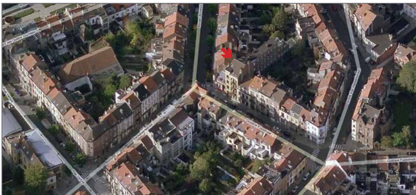
Rue Gustave Fuss 35 - 1030 Schaerbeek

Tél: +32 2 541 88 88 GSM: +32 485 111 777 E-mail: sales@up.be